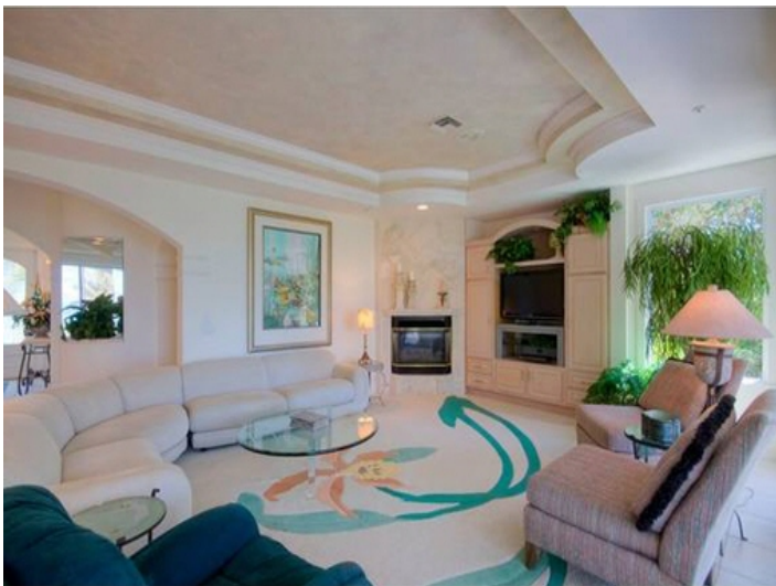
Liebliches Wohnzimmer mit Kamin