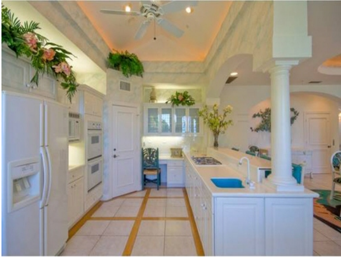
Vollausgestattete Küche mit Frühstücksbar