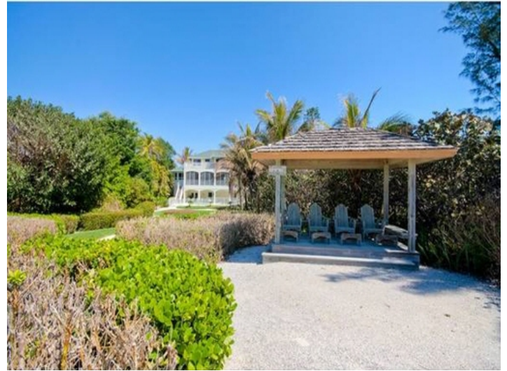
Überdachte Terrasse am Strand