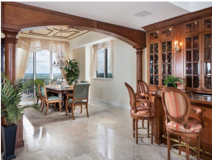
Große, geräumige Essecke