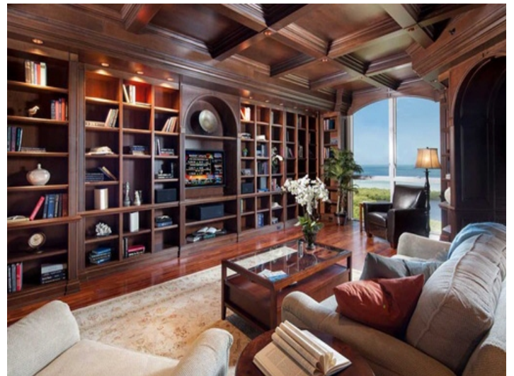
Bibliothek im englischen Stil