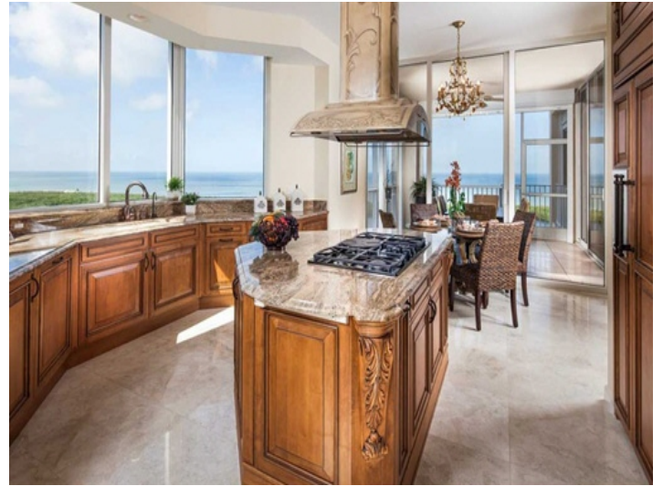
Küche mit Kochinsel