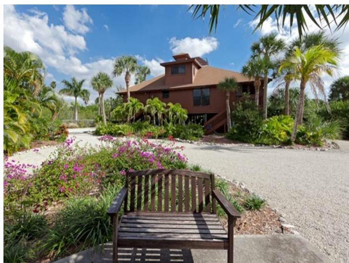
Terrasse direkt am Strand