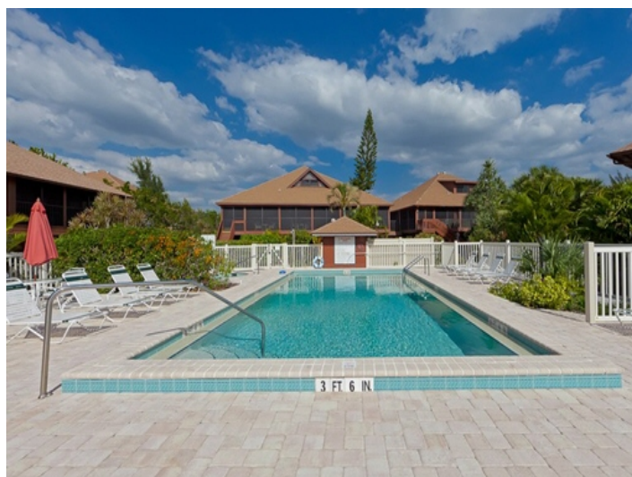
Gemeinschaftlich nutzbarer Pool